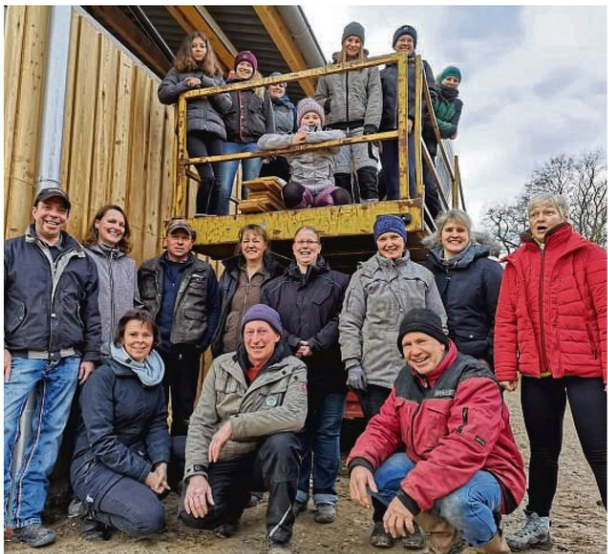
Gut gelaunt und nicht zu bremsen: das Bauteam des RuF Okel. Die Vereinsmitglieder treffen sich seit vergangenen Juni jeden Samstag, um bei der Gestaltung des neuen Vereinsgeländes anzupacken.

In Osterholz steht den 200 Mitgliedern des Reitvereins ein erstklassiges Areal zur Verfügung. Dass hier bis vor wenigen Jahren noch regelmäßig Motocross-Kennen ausgetragen wurden, ist heute nicht mehr erkennbar – Radlader und Planieraupen haben in den vergangenen Monaten ganze Arbeit geleistet. So bieten sich den Pferdesportlern in Hinblick auf Größe, Lage und Ausreitmöglichkeiten auf ihrem Vereinsgelände beste Voraussetzungen. Immerhin umfasst das Areal inklusive Sport- und Weidflächen elf Hektar. Jede Menge Platz also für Voltigierer, Spring- und Dressurreiter, Ponyakademie und Gespannfahrer des RuF Okel. Während der Verein das