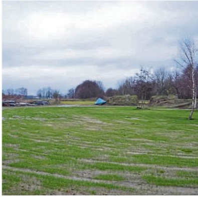
Auf dem Springplatz spritzt das Gras. Auch der Dressurplatz (im Hintergrund) ist bereits fertiggestellt.

Neues Vereinsgelände des Reit- und Fahrvereins Okel und Umgebung e.V. in Osterholz