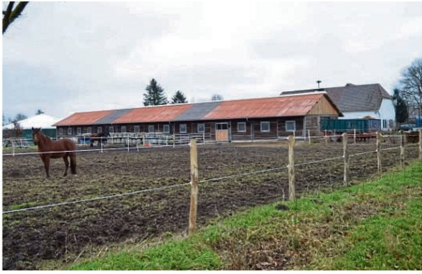
Die neu errichteten Stallungen bieten Platz für 30 Pferde. Auch das moderne Longierzelt (li.) steht bereits. Im Hintergrund ist das Gasthaus Hillmann erkennbar.