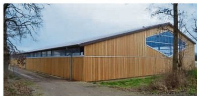
Die Stahlgerüsthalle ist an den Seiten mit hellem Holz verkleidet. Das raute-förmige Lichtfenster an der Giebelseite verleiht dem Bau überdies seine besondere Charakteristik.

Tatsächlich sind die Abmessungen der Reithalle imposant: 26 mal 72 Meter umfasst die Grundfläche. Und mit einer Traufhöhe von 5,50 Metern ist eben auch jenes Maß gegeben, das bei Voltigiermeisterschaften auf höchstem Niveau gefordert wird. Gleichwohl fügt sich die an den Seiten mit hellem Holz verkleidete Stahlgerüsthalle harmonisch ins Landschaftsbild ein. Das große, raute-förmige Lichtfenster in der straßenseitigen Giebelwand verleiht dem Bau überdies seine besondere Charakteristik.