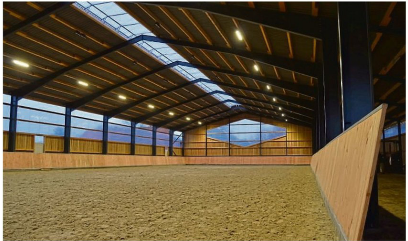
Die neue Reithalle bietet Voltigierern, Reitern und Fahrsporthlern ideale Trainingsbedingungen. Darüber hinaus erlauben die Abmessungen der Halle die Durchführung von Landesmeisterschaften und Deutschen Meisterschaften im Voltigieren.